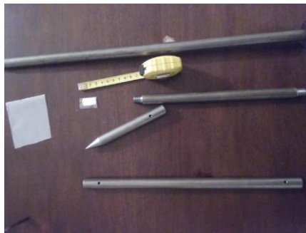
Puntazza smontata con le tre cavità in cui sono collocati i dosimetri passivi

Le cavità in cui sono collocati i dosimetri sono a 90, 60 e 30 cm dal piano del terreno. In questa maniera si riesce a misurare la concentrazione del radon a tre diverse altezze.