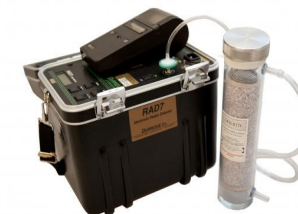
Rad7, per la misurazione attiva della concentrazione di gas radon in 24h.