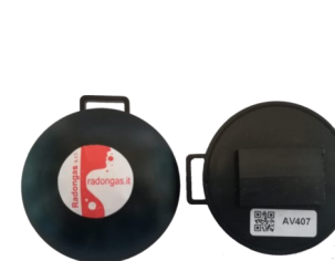
Dosimetro passivo NRPB/SSI